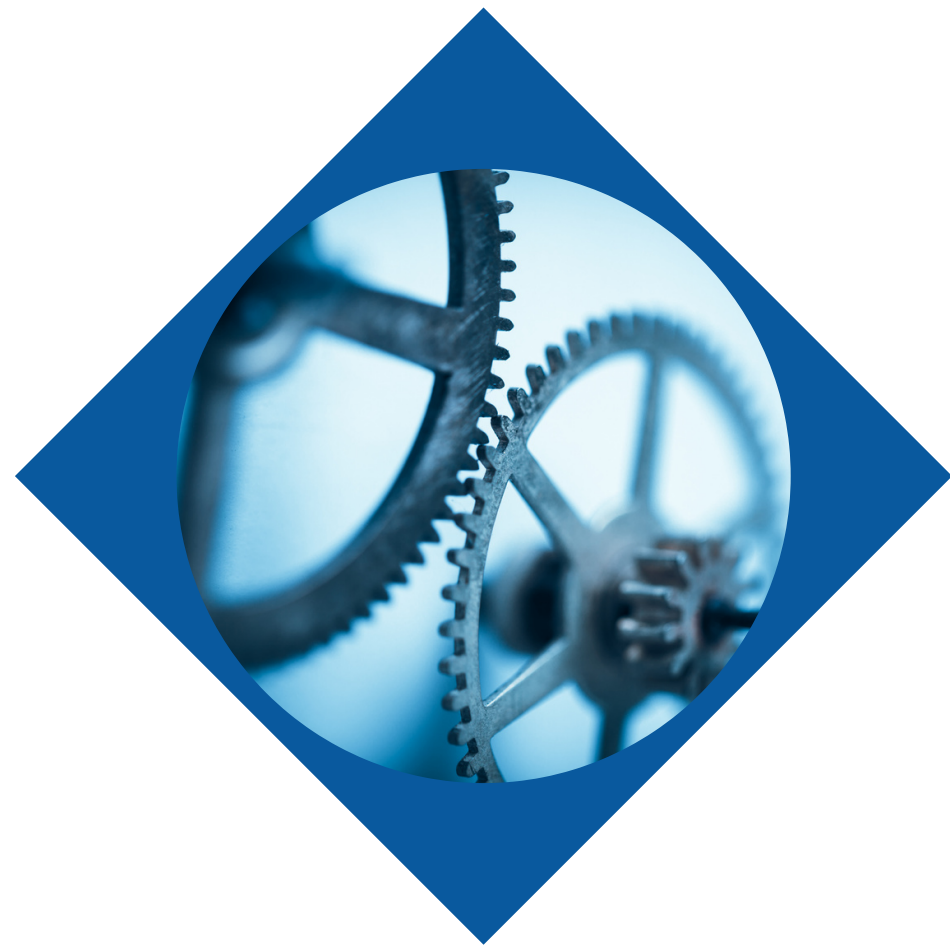
Aspek Proses (30%)