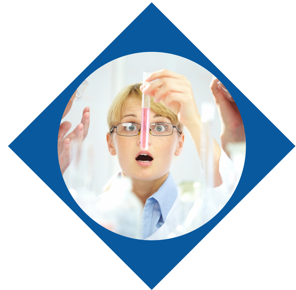
Aspek Outcome (30%)