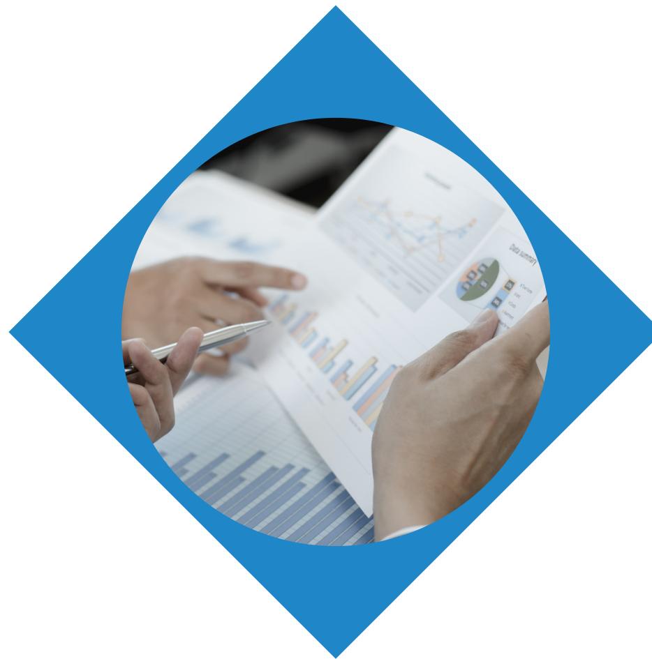
Aspek Output (40%)