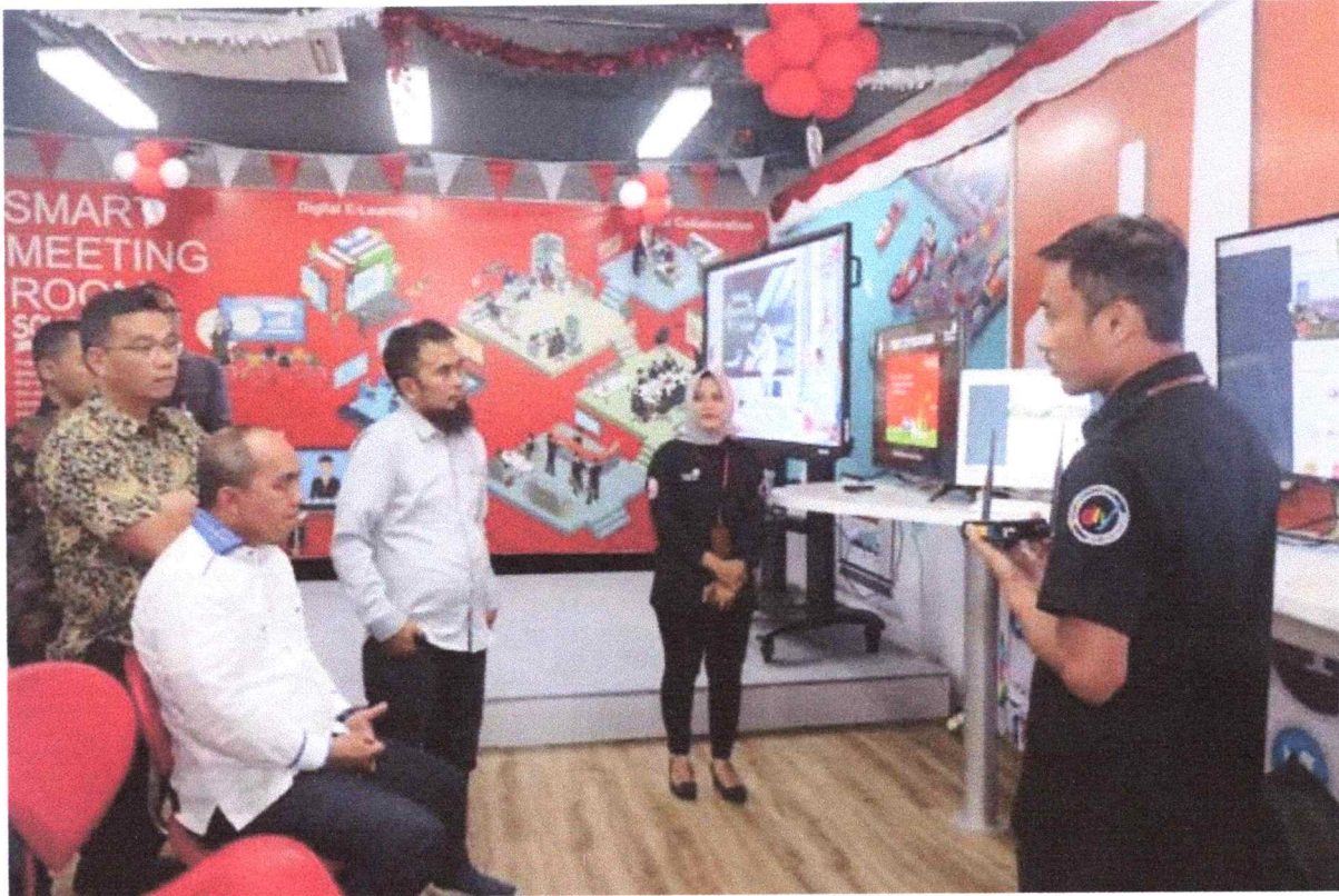
Walikota Pangkalpinang H. Maulan Aklil kala mengunjungi Living Lab Smart City Nusantara