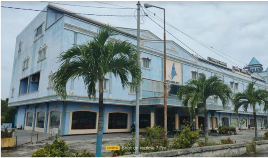
Hotel Pantai Marina di Bengkalis

Sebagai informasi tambahan, Bapenda Kabupaten Bengkalis pada tahun 2020 lalu memasang target perolehan pajak sebesar Rp60.500.000.000,00 Alhamdulillah, realisasi sebesar Rp63.710.380.457,25 atau naik 105,31%. Kemudian, target pajak tahun 2021 sebesar Rp79.095.000.000,00 realisasi sampai dengan 30 November 2021 beberapa hari lalu sebesar Rp68.572.886.127,00 atau mencapai 86,70%.