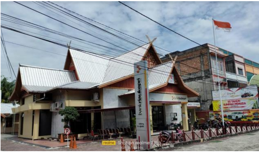
Kantor Bank Riau Kepri Cabang Bengkalis

Dijelaskan Syahrudin, tujuan launching QRIS kemarin, yang pertama untuk mendorong pemerintah melakukan inovasi, mempercepat dan memperluas pelaksanaan elektronik transaksi pemerintah daerah serta mendorong integrasi ekonomi dan keuangan digital dalam mewujudkan efisiensi dan efektivitas, transparansi dan tata kelola keuangan yang terintegrasi. Termasuk juga meningkatkan kepercayaan masyarakat terhadap pemerintah daerah. Ketika WP akan melakukan pelunasan pajaknya, pemerintah daerah memberi ruang kepada masyarakat para WP untuk membayar pajak tadi secara elektronik digital sehingga WP tidak perlu melakukan hal-hal lain yang berkaitan dengan pelunasan pajaknya ini karena dengan menggunakan sistem QRIS, maka sudah terlapor di bank artinya pembayaran tadi langsung ke bank daerah atau Bank Riau Kepri. Juga memberikan pelayanan kepada masyarakat yang WP tersebut secara maksimal. Inilah tujuan pemerintah daerah melakukan proses pembayaran (pajak dan restitusi) melalui sistem QRIS.