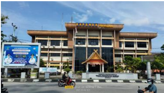
Kantor Badan Pendapatan Daerah (Bapenda) Kabupaten Bengkalis

BENGKALIS, POTRETNEWS.com — QRIS, Quick Response Code Indonesian Standard adalah standarisasi pembayaran menggunakan metode QR Code agar proses transaksi dengan QR Code menjadi lebih mudah, cepat dan terjaga keamanannya. QR (Quick Response) Code adalah sebuah kode matriks yang dibuat oleh