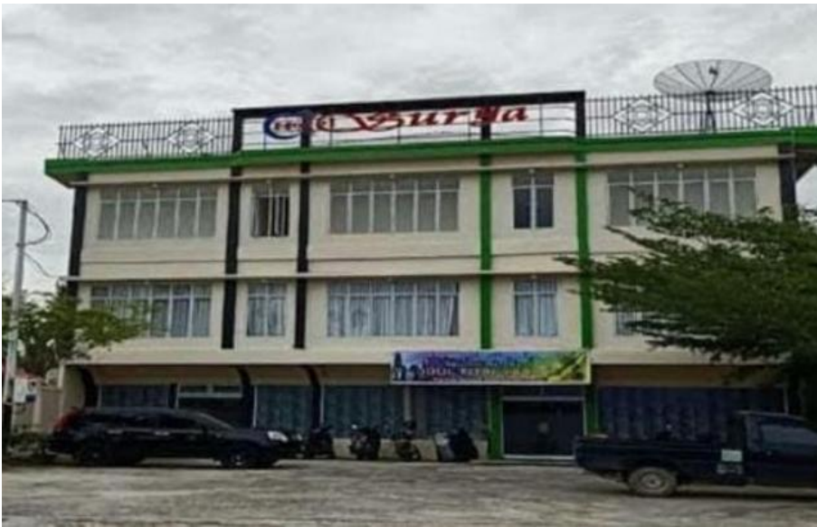
Hotel Surya di Bengkalis

Dengan MoU yang telah ditandatangani, salah satunya mungkin Bank Riau Kepri bisa membantu Pemda dalam meningkatkan PAD. Kalau PAD naik, dalam sisi banknya kan bisa membantu Pemda yang punya saham di Bank Riau Kepri sehingga mungkin bisa menambah pendapatan defiden